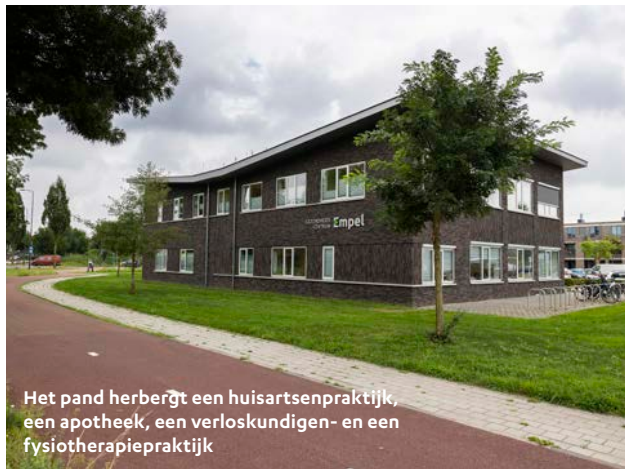
Het pand herbergt een huisartsenpraktijk, een apotheek, een verloskundigen- en een fysiotherapiepraktijk

'Na 20 jaar in het oude pand hebben we nu een koffiekamer en kunnen we samen lunchen, heerlijk'