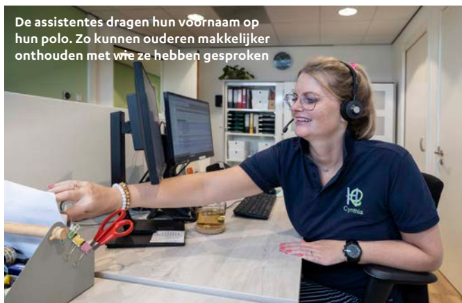
De assistentes dragen hun voornaam op hun polo. Zo kunnen ouderen makkelijker onthouden met wie ze hebben gesproken