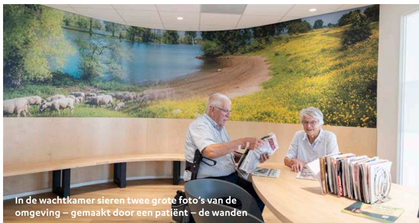
In de wachtkamer sieren twee grote foto's van de omgeving – gemaakt door een patiënt – de wanden