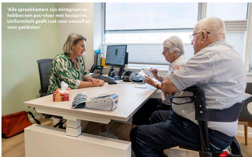
'Alle spreekkamers zijn mintgroen en hebben een pvc-vloer met houtprint. Uniformiteit geeft rust voor onszelf en voor patiënten'