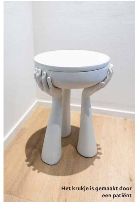
Het krukje is gemaakt door een patiënt