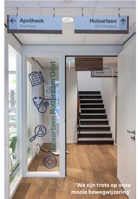
'We zijn trots op onze mooie bewegwijzering'