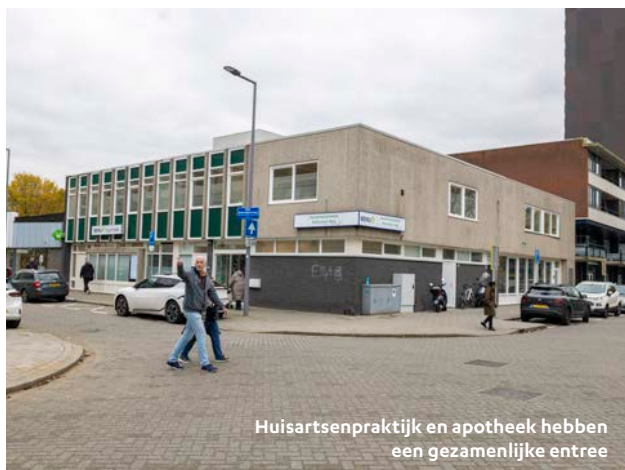
Huisartsenpraktijk en apotheek hebben een gezamenlijke entree

De teamkamer wordt intensief gebruikt, 'behalve het bankje; we zitten altijd aan tafel'