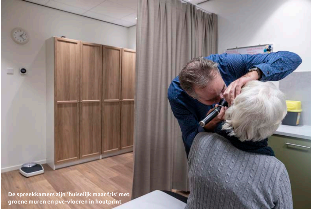
De spreekkamers zijn 'huiselijk maar fris' met groene muren en pvc-vloeren in houtprint