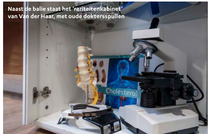
Naast de balie staat het 'rariteitenkabinet' van Van der Haar, met oude doktersspullen